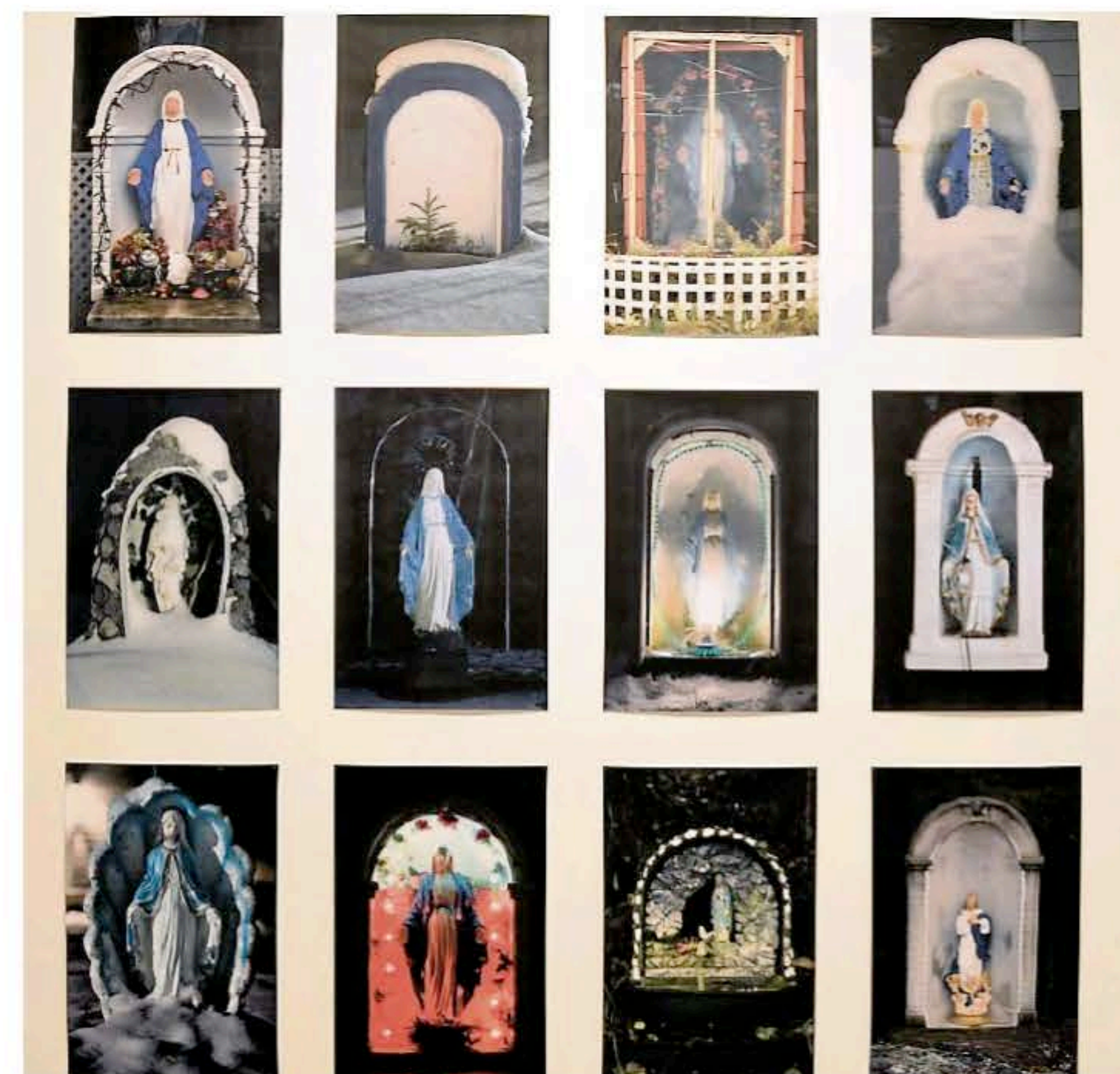
Mystères vus et entendus (verbatim de miracles). Mariane Tremblay propose notamment une série de 12 photos de ces petits espaces religieux voués à la Vierge prises entre Alma et Saguenay.

À côté d'une grande photo d'une maison détruite par un incendie, deux histoires évoquant l'intervention de saints sont racontées sur des morceaux de bois dans Mystères vus et entendus (verbatim