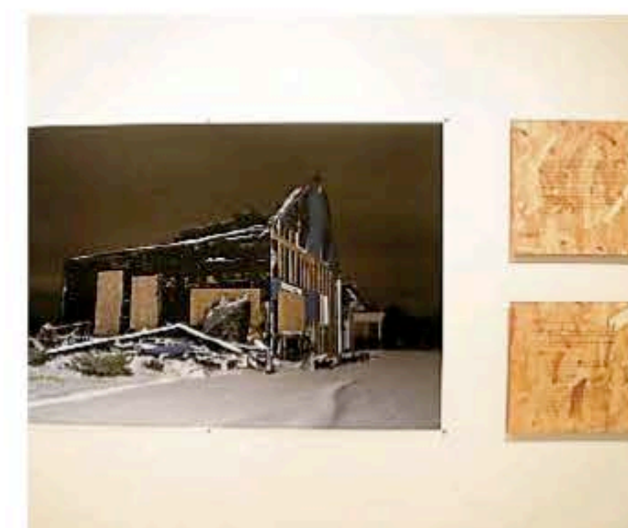
À côté d'une grande photo d'une maison détruite par un incendie, deux histoires évoquant l'intervention de saints sont racontées sur des morceaux de bois dans