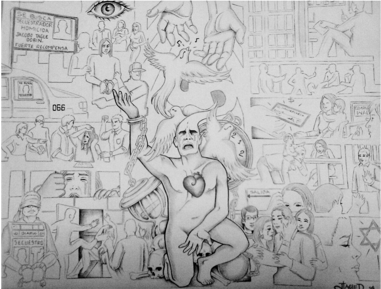
Dessin de Jacobo Tagle Dobin

Ensemble, pour un monde plus juste. Together for a better world. Juntos, hacia un mundo más justo.